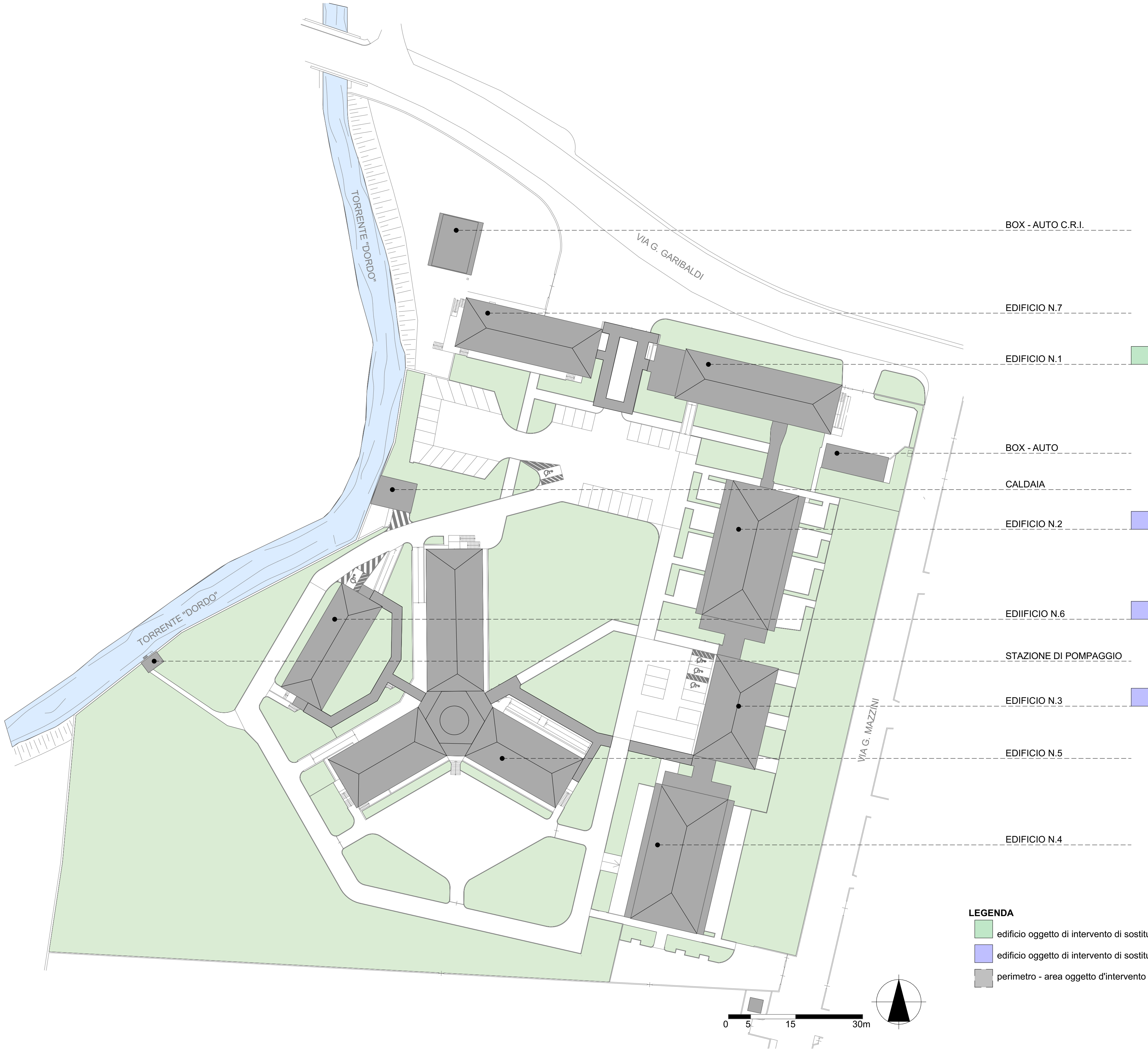
PL-01 Planimetria Generale 1:500