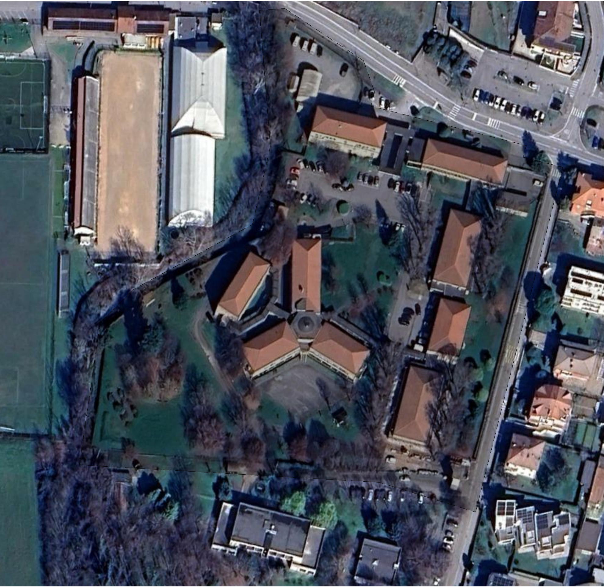
OF-01 Orto Foto 1:1000